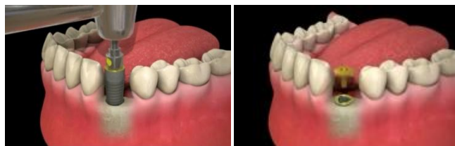
Mise en place de l'implant