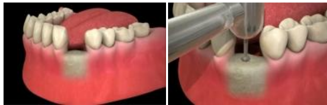
Accès au site

Une anesthésie locale est réalisée. La gencive est incisée et dégagée pour avoir accès au site osseux où la pose de l'implant est prévue. Le passage successif de forets de différents diamètres permet de préparer le logement dans lequel l'implant est ensuite mis en place.